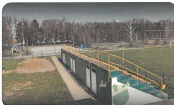
Slika 1. Stadion Klas